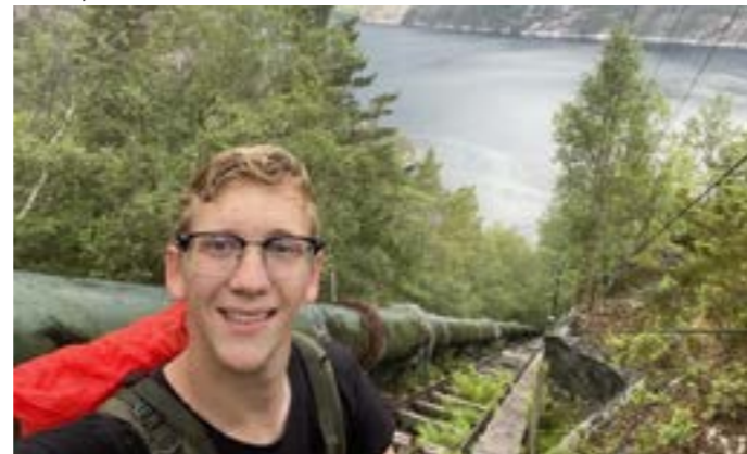
De 4444 trappen beklommen langs de Lysefjord