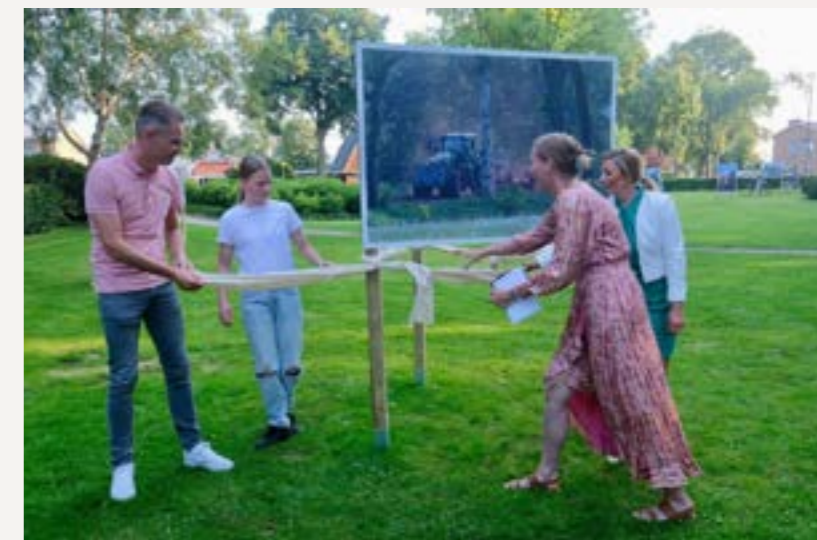
^ fotograaf: Huib Rutten | v fotograaf: Huib Rutten

De foto's van het onderdeel 'Heden' stonden voor de dorpsheuvel en de kerk. De andere onderdelen bij de Zwarte Racker. Vooraf werden we als stichting gevraagd of we niet bang waren voor vernielingen. Maar gelukkig bleken deze zorgen totaal overbodig. Vier weken lang bleven alle fotopanelen staan zonder een krasje! We willen daarom niet alleen alle bezoekers bedanken, maar we zijn ook ontzettend trots, dat dit nog kan in ons dorp! Bedankt daarvoor!