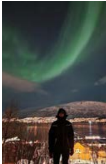
< Het noorderlicht in Tromsø

Ik heb een half jaar (van februari tot juli) gestudeerd aan de University of South-Eastern Norway in Tønsberg. Hier volgde ik de studie Outdoor Education and Experiential Learning. Deze minor richt zich op het geven van lessen buiten het klaslokaal door middel van bewegend leren en het onderwijzen van natuureducatie aan kinderen.