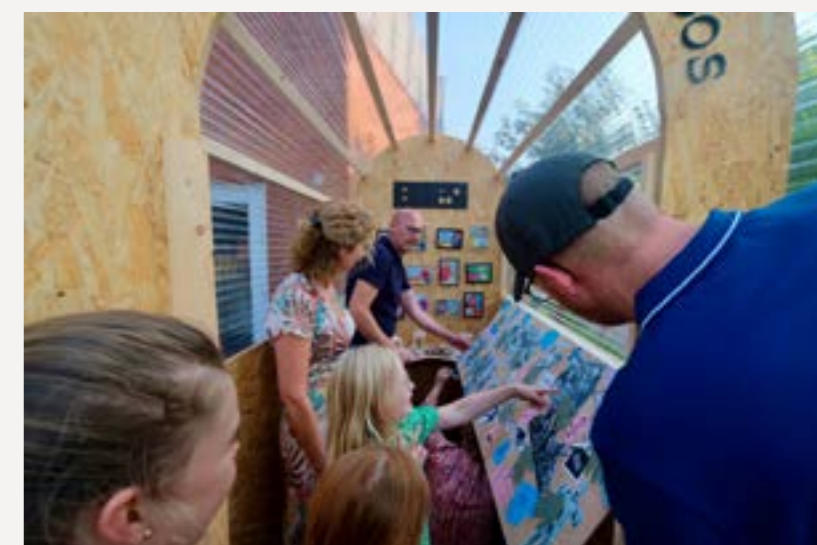
< fotograaf: Wouter Homan | v fotograaf: Willy Voppen