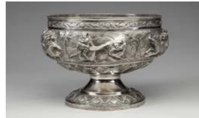
Schaal uit India/Pakistan: collectie Museum Janning