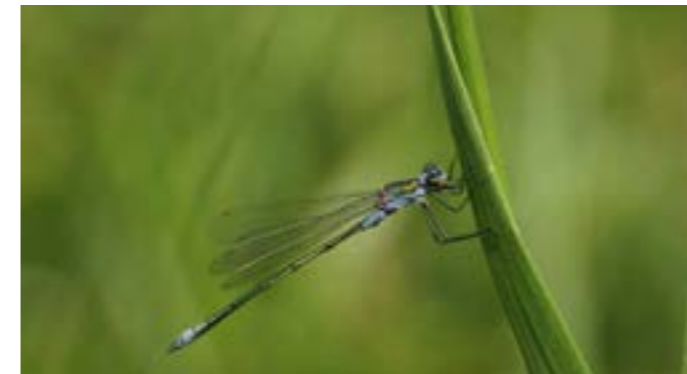
Gewone pantserjuffer - foto: Twan Teunissen