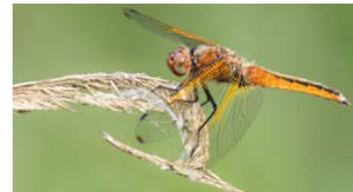
Bruine korenbout - foto: Jonathan Leeuwis